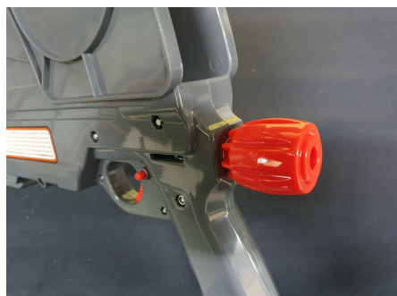
Podkładka i pokrętło

Aby rozładować napiętą wyrzutnię należy wystrzelić rzutka. NIE WOLNO z wyrzutni strzelać na sucho!