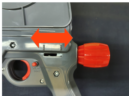
Regulacja siły sprężyny